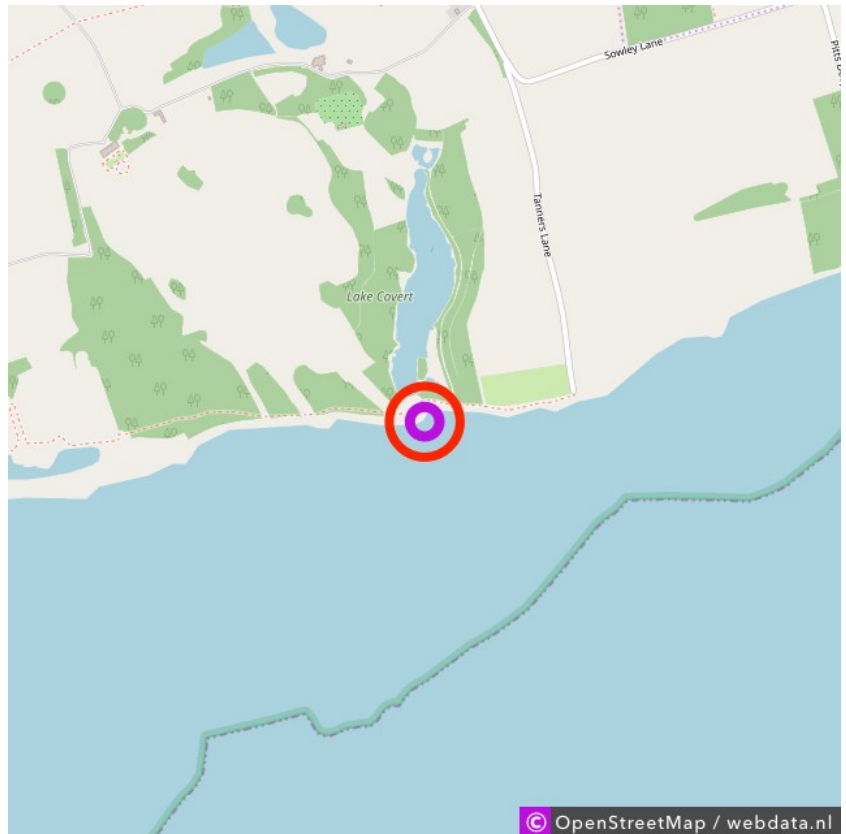
East End Beach (25-10-2020)